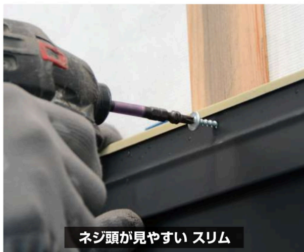
ネジ頭が見やすい スリム