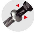
ネジ頭が見やすい 摩耗に強い