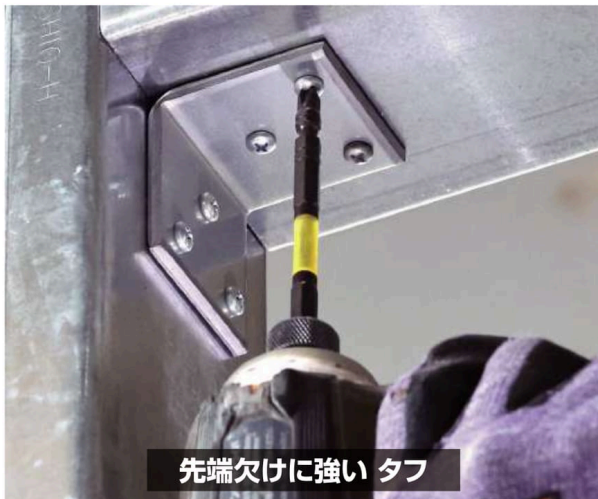
先端欠けに強い タフ