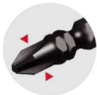
先端が強い 摩耗に強い