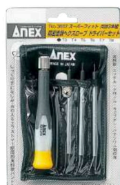
No.3602 精密差替ヘクスローブ ドライバーセット3本組