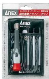
No.3600 精密差替ドライバーセット 3本組