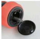
ビットが収納できます